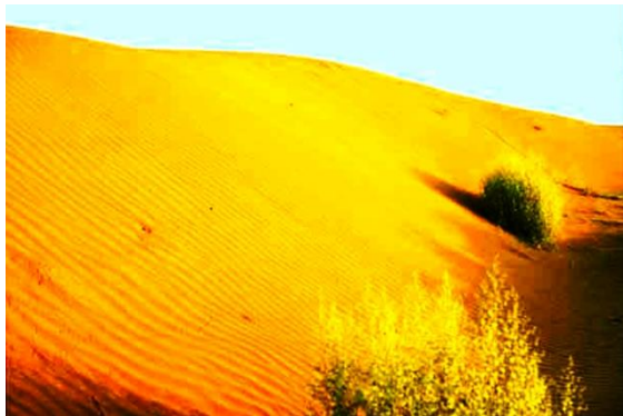
تصویر 2 : توسعه دشت در جنوب قندهار.

آب آن ماده حیاتی و منبع انرژیست که اساس و زیربنای حیات، صنعت و ترقی را در يك کشور تشکیل می دهد. ضرورت به آب در افغانستان روز به روز بیشتر می گردد، زیرا از یک جانب نفوس مملکت به سرعت زیاد می شود و از جانب دیگر منابع آب همزمان به شدت کاهش می یابند. گذشته از تسریع ازدیاد نفوس ضرورت به آب به خاطر توسعه زراعت و صنعت که به آب فراوان و انرژی نیازمند اند، بالا می رود و از جانب دیگر کوشش خواهد شد که زمین های بیشتری تحت زراعت آورده شوند که طبعاً مصرف آب را بیشتر می سازد. بلند رفتن درجه حرارت هوای زمین که کشور های پیشرفته صنعتی در تزايد آن رول عمده و اساسی دارند، باعث آب خیزی و توفان های مدهش شده و خشکسالی های متوالی را بار آورده که بخصوص در افغانستان از عواقب سوء آن 1 در ولایات زابل، قندهار، هلمند، نیمروز، فراه، هرات، بادغیس، فاریاب، جوزجان، شبرغان، بلخ، کندز و بغلان میلیون ها هکتار زمین زراعتی به دشت تبدیل شده و دامنه و وسعت آن در حال افزایش است (تصاویر 1 و 2).