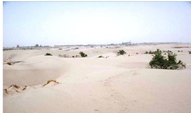
تصویر 1 : پیشروی ریگ در نیمروز و نابودی اشجار و زمین های زراعتی.

کمبود آب، خواهی نخواهی کمبود مواد غذایی را در قبال دارد که در نتیجه هموطنان ما در مجموع و مخصوصاً ساکنان مناطق کم آب در منجلاب گرسنگی دست و پا می زنند. با در نظر داشت عوامل بالا منابع آب و انرژی آبی و یا هایدرولیکی افغانستان اهمیت بیشتر کسب می نمایند و این سؤال طرح می گردد که چطور میتوان از این منابع محدود استفاده معقول و دوامدار نمود و منابع آب را مدیریت سالم کرد. مخصوصاً که در طول حدود چهار دهه اخیر پلانهای برای تأمین آب به منظور زراعت، نوشیدن، حصول انرژی و انکشاف صنعت روی دست گرفته نشده و بر منابع محدود آبهای مملکت هنوز بی رحمانه دستبرد زده می شود. از جانب دیگر انکشاف و توسعه اقتصادی، اجتماعی و فرهنگی افغانستان زمانی میسر می گردد که از منابع طبیعی آن، با در نظر داشت حفظ محیط زیست، استفاده معقول و دوامدار صورت بگیرد. زیرا رفاه اجتماعی در یک محیط سالم زیست که اساس آنرا آب تشکیل می دهد مهیا میگردد. بنابراین توازن اقتصادی، انکشاف متوازن و رفاه اجتماعی روی استفاده معقول و دوامدار از منابع طبیعی از جمله آب و تقسیم عادلانه آن استوار می باشد، مخصوصاً که منابع آب کشور یکسان نبوده در سلسله کوه های بلند مملکت تراکم کرده اند. اگر به تنظیم و مدیریت آبها و منابع انرژی آبی در افغانستان توجه جدی صورت نگیرد، کم آبی، فقر و امراض ناشی از فقر غذایی و آب غیر صحی در این کشور ادامه خواهند یافت. در حال حاضر نبود ظرفیت های متخصص و بی کفایتی مقام های دولت افغانستان و دخالت کشورهای بیگانه خاصاً کشور های همسایه از دلایل اساسی عدم استفاده درست از آبهای وطن پنداشته می شوند.